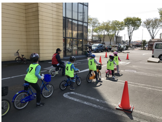
自転車指導教室の風景